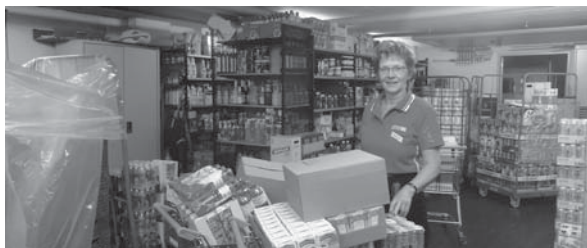
Die Spar-Leiterin im Lager im Untergeschoss