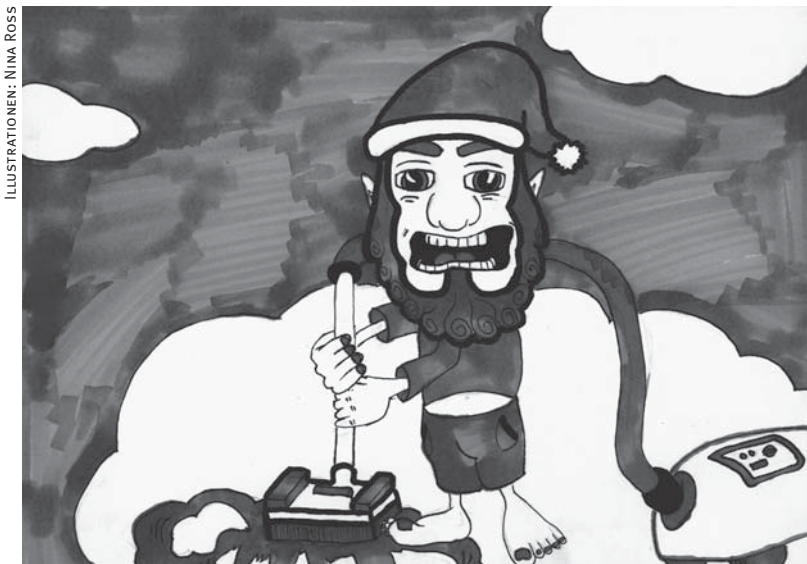
ILLUSTRATIONEN: NINA ROSS